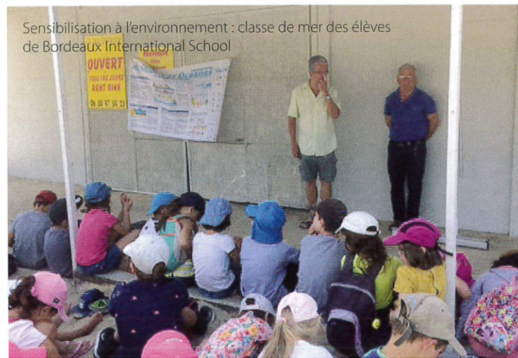
Sensibilisation à l'environnement : classe de mer des élèves de Bordeaux International School

Engagé une démarche zéro pesticide et "Mon restau responsable" +